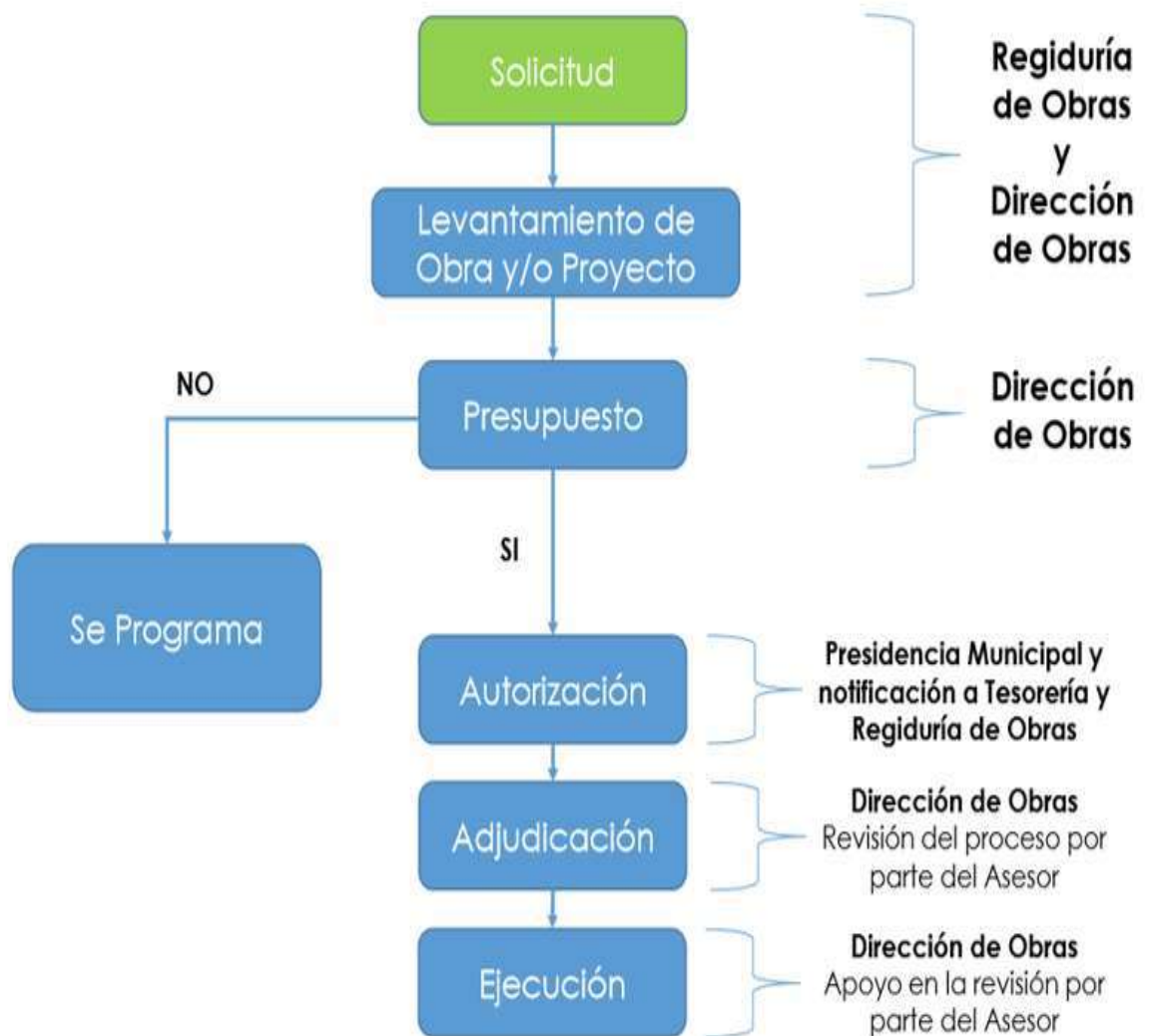
Diagrama de Flujo